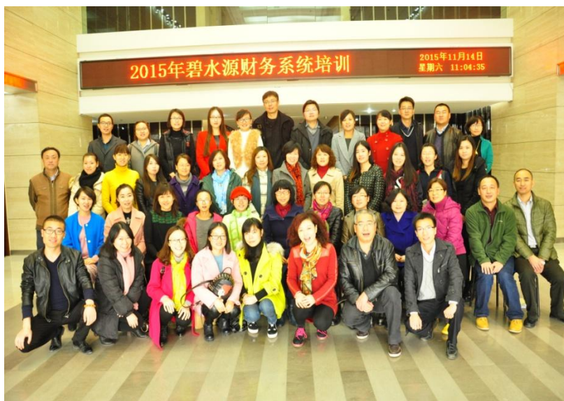
2015 年碧水源财务系统培训